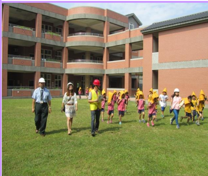
教育局長視導學生疏散過程