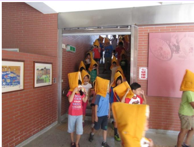
學生進行避難疏散路線