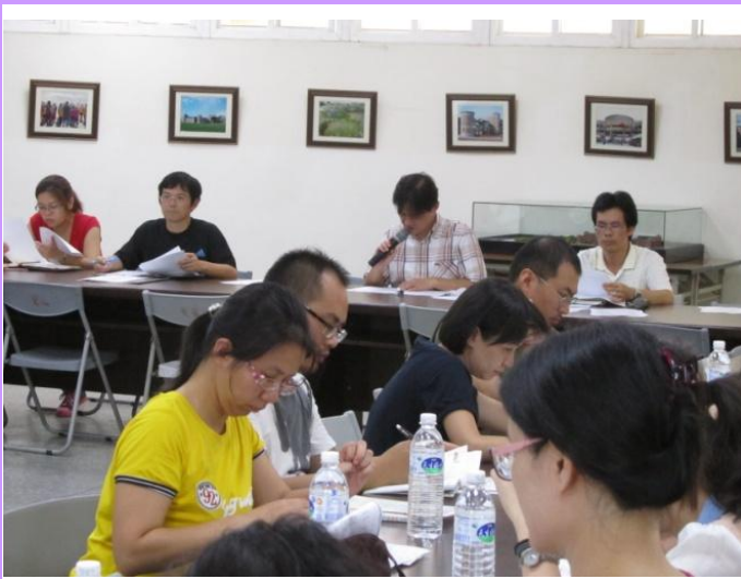
防災小組結論於教師會議轉達